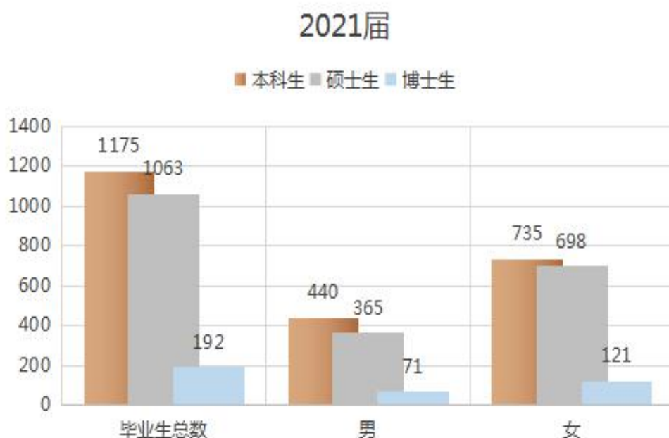
图 1-1 天津医科大学 2021 届毕业生基本情况

2021届全校共有毕业生2430人（其中本科生1175人；研究生1255人中，含硕士研究生1063人、博士研究生192人）。详见图1-1。