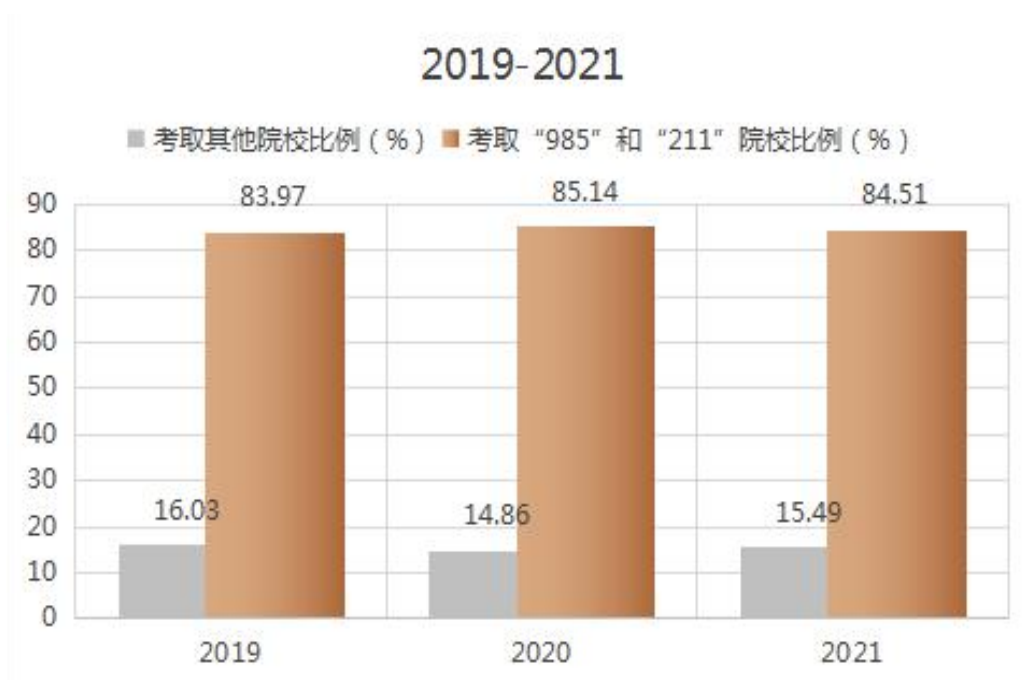
图 1-3 天津医科大学 2019-2021 届本科毕业生国内升学情况

研究生继续深造情况保持逐年稳步增长，2019 年和 2020 年升学比例分别为 12.54%和 20.98%，2021 年升学人数达到 227 人，比例提升至 21.35%。详见表 1-2。