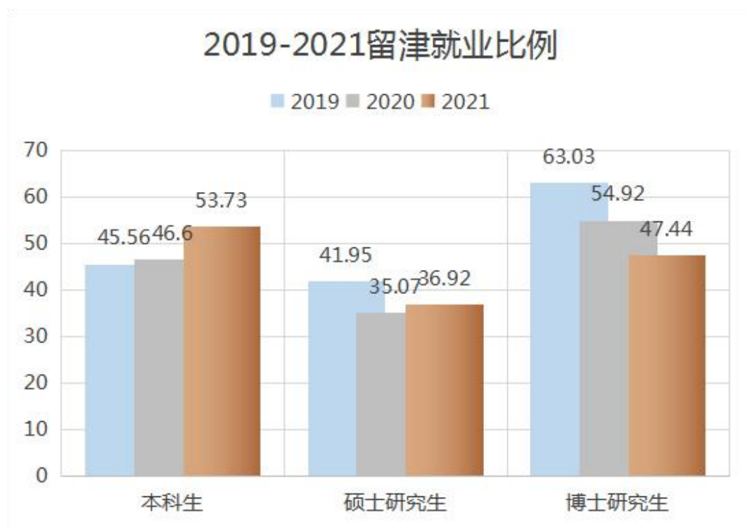
图 1-4 天津医科大学 2019-2021 届毕业生留津就业情况

2021 届本科毕业生选择留津就业的比例为 53.73%，近三年呈逐年上升趋势。硕士研究生 21 年较 20 年有略微提升，但仍比疫情前下降了 5.03 个百分点；博士研究生留津就业比例呈逐年下降趋势，更多选择回生源地就业，占就业人数的百分之 27.27%。。如图 1-4、表 1-4 所示。