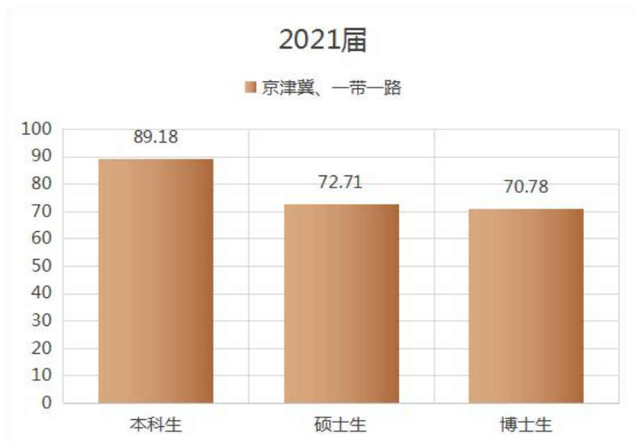
图 1-5 天津医科大学 2021 届毕业生“京津冀”“一带一路”地区就业情况

学校积极响应国家“一带一路”和“京津冀协同发展”战略，立足京津冀，面向全中国，为“健康中国”建设服务。2021 届就业的本科、硕士、博士毕业生中，在“京津冀”、“一带一路”地区就业的比例分别为 89.18%、72.71%、70.78%。详见图 1-5。